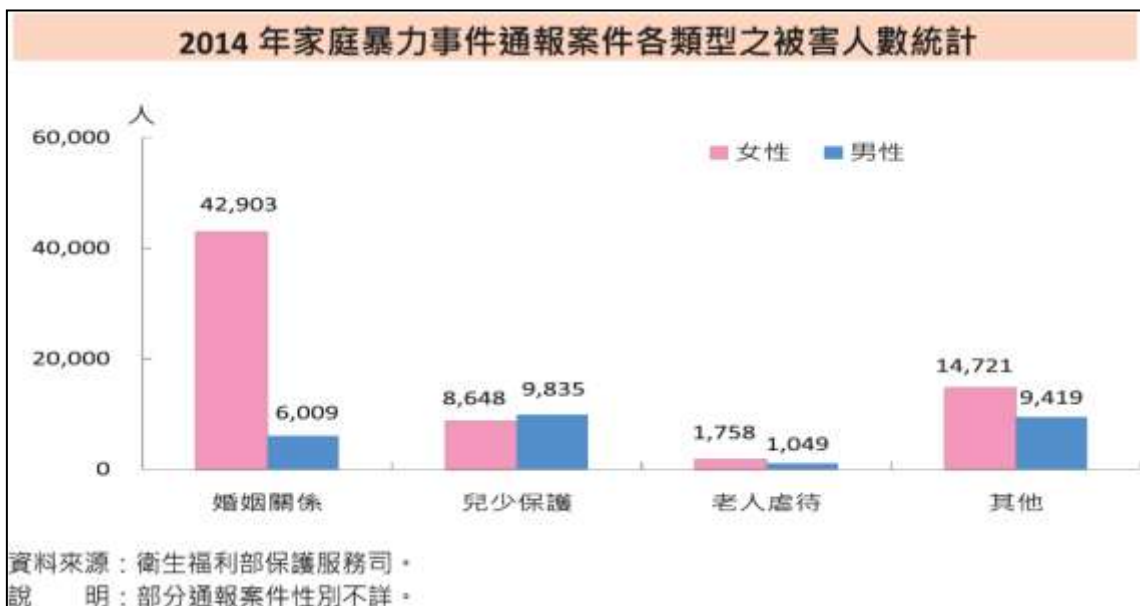
圖一：2014年家庭暴力事件通報案件各類型之被害人數統計 資料來源：《2016年性別圖像》，頁16。

在制定家庭暴力防治法之後，政府近年仍持續不斷加強宣導反家庭暴力，並建立完善的通報機制，除了各政府皆有專責機關外，也與民間團體合作，建立起更完善的防護網，其中包含被害人保護扶助，加害人處遇機制。2014 年（民國 103 年），該年家庭暴力通報案件共 11.5 萬件，被害人數 9 萬 5,663 人；在案件類型中約有半數基於婚姻關係中的暴力行為〈包含離婚與同居〉，被害人中有 8 成 7 的比例為女性，這些女性多為親密關係中的被害人；而在納入兒少保護、老人虐待及其他類型案件的被害人後，有 7 成 11 的被害人為女性。 26