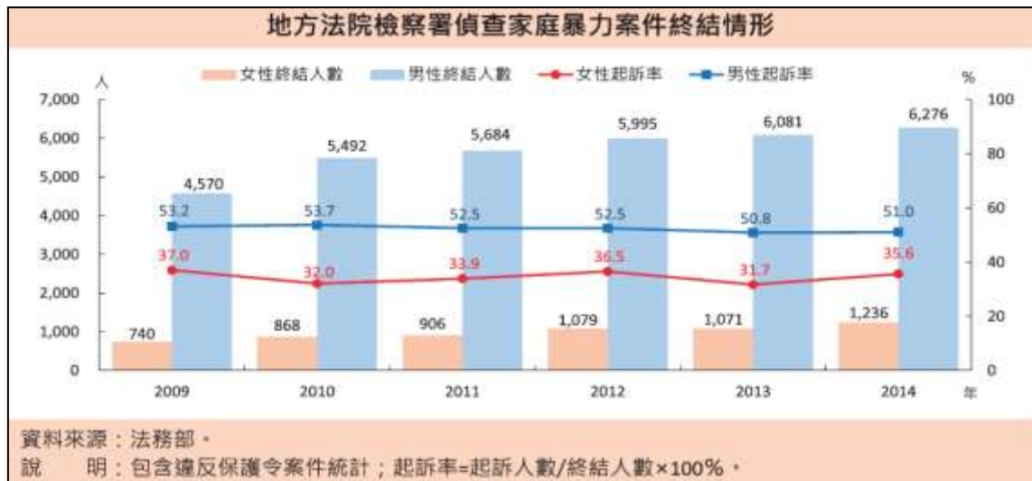
圖二：2014年地方法院檢察署偵查家庭暴力案件終結情形

占 43.2%〈其中男性嫌疑人被起訴的仍以 51% 高於女性的 35.6%〉；另不起訴處分偵查終結的 3,246 人中，有將近半數（49.3%）是家暴被害人撤回告訴，相較 2009 年六成（60.3%）的情況有所下降。 27