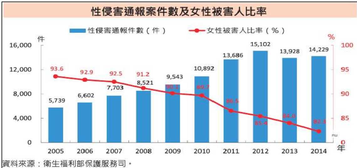
圖四：性侵害通報案件數及女性被害人比率

2014年（民國103年）性侵害案件經地方法院檢察署偵查終結共計4,440件，相較2009年增加24.4%，其中偵查終結的4,735名嫌疑人中，起訴者共2,201人（女性占1.1%，男性98.9%）；起訴率46.5%相較2009年略降3.8%。 31