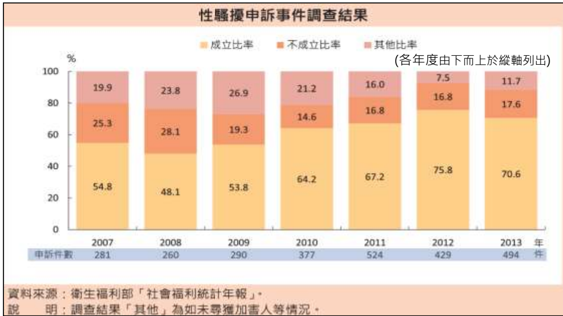
圖七：性騷擾申訴事件調查結果