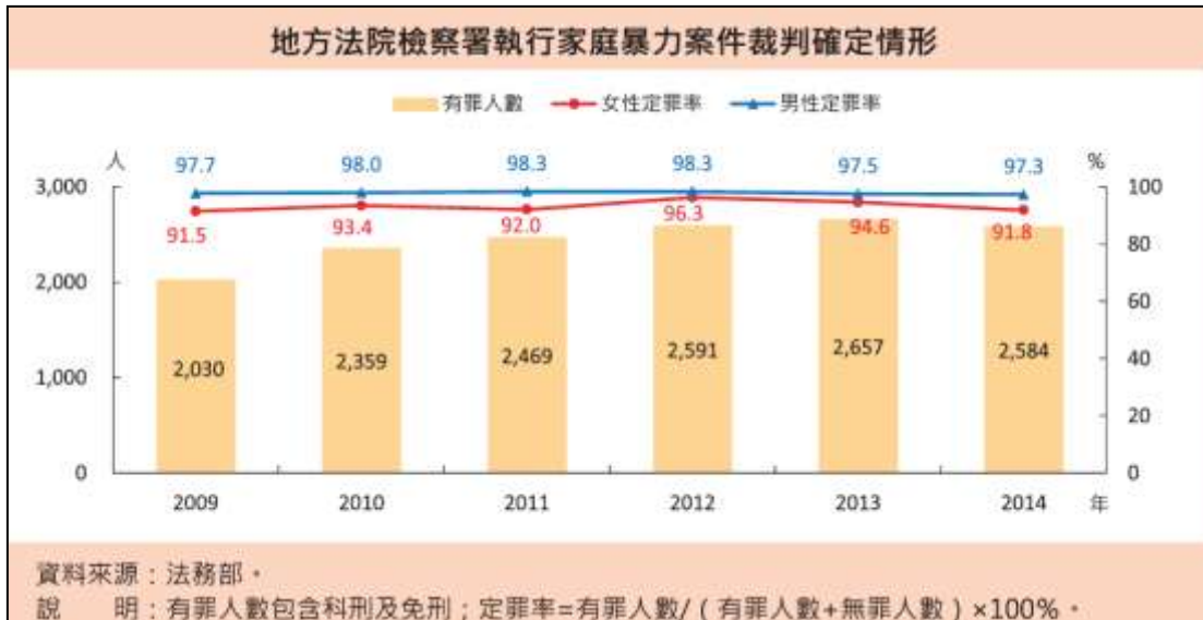
圖三：2014年地方法院檢察署執行家庭暴力案件裁判確定情形